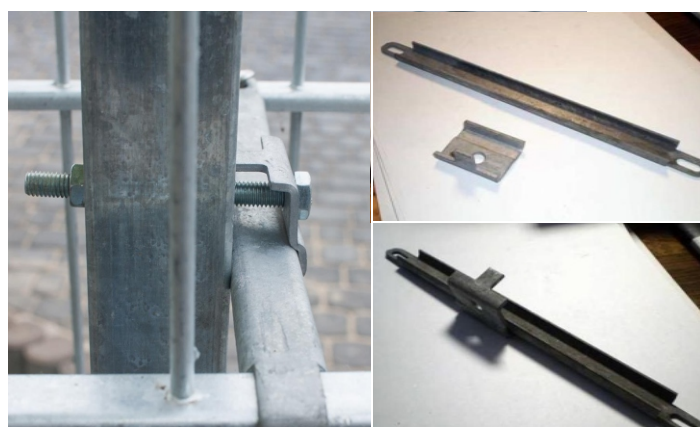
4. Gabionens väggar fixeras till stolpens sida med hjälp av U-formad profil/stabilisator. Ett hål borras i stolpen och stabilisatorn fixeras med hjälp av en speciell klämma och en M8 skruv.