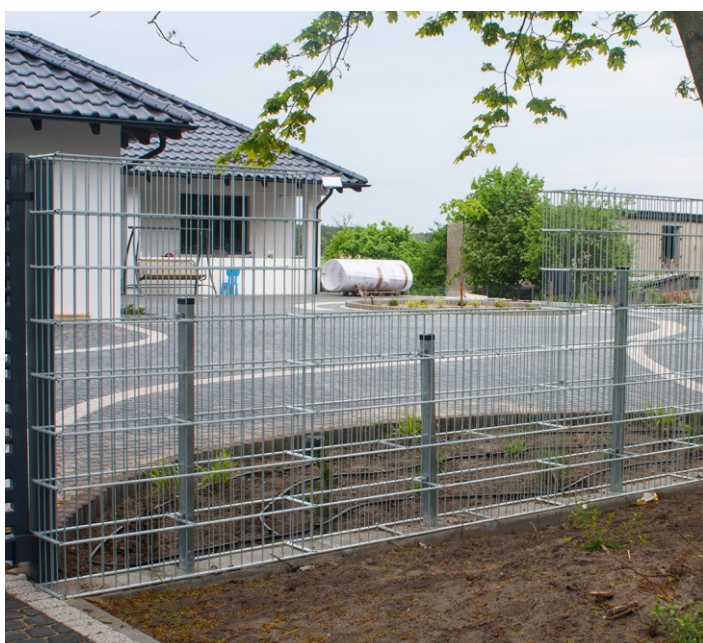
3. Gabionens låda byggs ihop på den förberedda grunden.